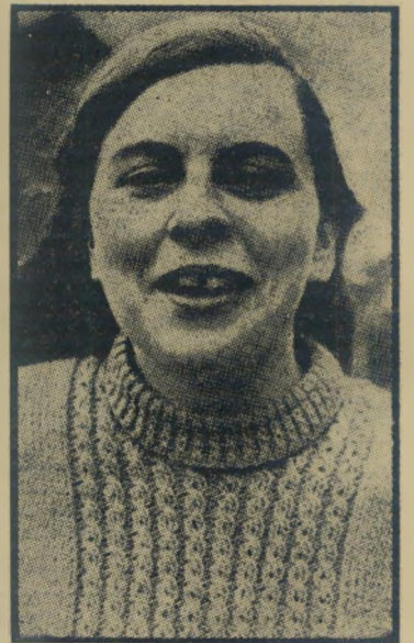
ח"כ דוודין צורחים כמו אינדיאנים!

מה עורר את הוועדה מתרדמתה הארוכה? היתה זו הודעה של קונגרס הבישופים הי-איטלקיים, שהתכנס ברומא השבוע, והחליט כי יש להמשיך באיסור הגירושין. חברי