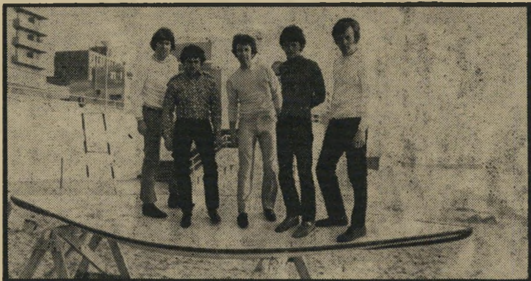
"הבלו ג'ינס" מתנדררים

רים לאחר-מכן החלה תנועת כוח הפרחים לאבד מזוהרה, ויחד עימה קמלה גם הצלחתם של אנשי העציצים. הם ניסו למלא את עציציהם בשם חדש, הקליטו תקליט תחת השם החברים, אולם מולם לא השתנה. עתה הגיעו טוני, פיטר, רובין וריקי לישראל, כשהם שרים שוב תחת שמם הקודם — אנשי העציצים. אם לא לנסוע לסאן פרנסיסקו, הם אומרים, אז לפחות ללכת בעיקבות השמש לישראל. למרות שהסיני נון שהוליד את הלהקה, חלף מן העולם — אי אפשר שלא להתפעל מן ההארמוניה הנפלאה והנקייה, המאפיינת את שירתם. יחד עם אנשי העציצים הגיעו אלינו גם הבלו ג'ינס, חמשת הבחורים ילידי ליברפול, שהחלו את הקאריירה שלהם כמעט באותה תקופה, ובדיוק באותו מקום, בו נולדו החיפושיות. סיגנונם מכיל את כל סוגי ה-מוסיקה. החל מפופ סשט ורוק-אנדרול, וכלה ברייתם-איבלו והמיקצב-הכחול.