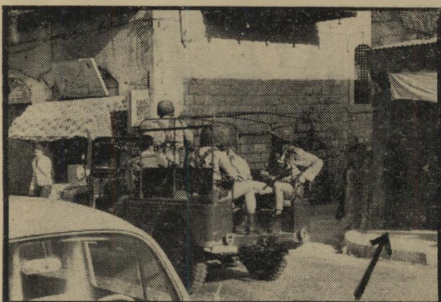
ילד (מסומן בחץ) עומד בצל של חנות, כשעובר גיפ של מישמר הגבול. הילד זורק אבן. (המצלמה לא הספיקה להנציח זאת.)