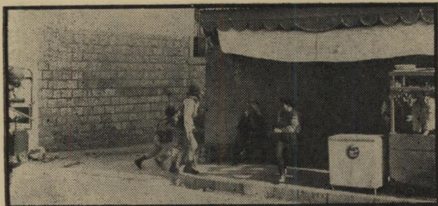
אנשי המישמר קופצים מן הגיפ. הילד בורח. בתמונה נראים אנשי המישמר בריצתם, כשחברם קופץ מן הגיפ משמאל.