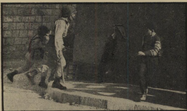
קטע מאותו תצלום מראה את הפרטים. ערבי יושב ומסתכל מן הצד.