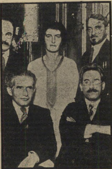
גולדה בשנת 1925

התמונה שפירסמתם בעולם הזה (1645), 1646, המציגה את גולדה מאיר, כביכול בשנת 1917, צולמה כעשר שנים אחר-כך!