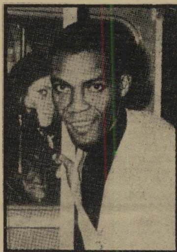
זמר דומנד דקר

דומנד דקר טוען שהוא עצמו לא שם לב לכך בכלל, בהתחלה. אבל היום מש־ תעשע כל עולם הפיזמונים בצירוף דמיק־ רים המוזר. להיטו החדש של דומנד נקרא "בני ישראל", והוקלט בחברת פירמידה. "אני מקחה שהעניין לא יגיע למדינות־ ערב", אומר דומנד, "הם עוד עלולים להחרים את התקליטים שלי." אבל חוץ מדאגה קטנה זו — קשה לומר שיש לו היום דאגות נוספות. הפיזמון הגיע הש־ כוע למקום החמישי באנגליה, והוא ממ־ שיך בתגופה רבה לצמרת.