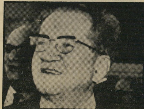
שרי-האוצר זאב שרף

לא מפני שספיר חדל להאמין בכשירות גולדה לשמש כ-