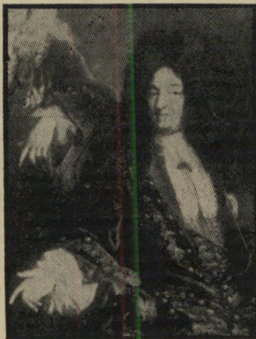
לואי ה-14 — כשכואבות השיניים

"האזרחים אינם מבינים כי אנשי צבא מיקצועיים, יאפתניים, מתגעגעים למלחמה, כי זוהי ההזדמנות היחידה שבה הם יכולים להצטיין ולזכות בתהילה. הקאריירה הצבאית בימי שלום משעממת ומתסכלת מאין כמוה." הצמרת הצבאית קשרה בקשר הדוק עם