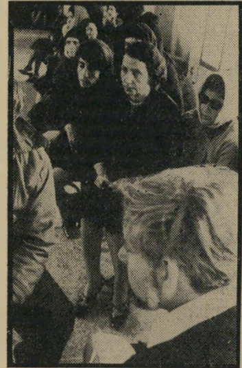
אבנרי בשיחה עם שובתות

למחרת בבוקר, עוד לפני השעה 7, הגיעו אבנרי וגלעדי, יחד עם צלם-המערכת אורי כוגן, לבית העירייה. הנשים, שכולן הכירו היטב את שמו של אבנרי, קיבלו את פניו בהתרגשות. במשך שעה וחצי מסרו לאבנרי את עדויותיהן ותלונותיהן, כש-הן מתחלפות על הכיסא ש-מולו.