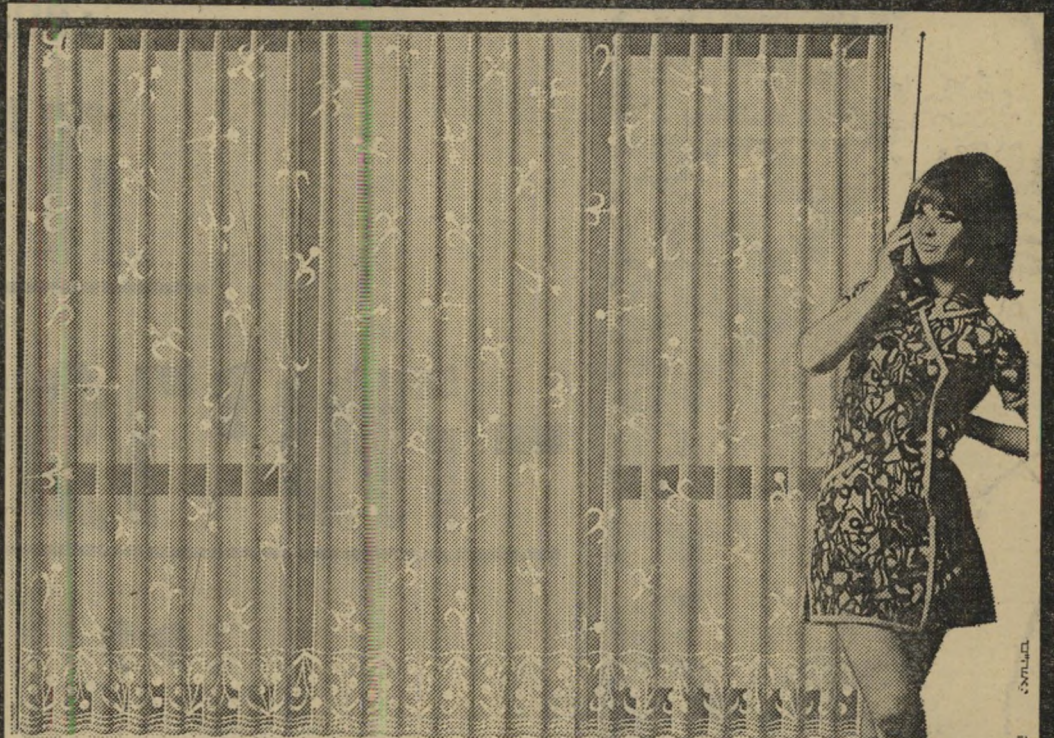
פריס תל אביב