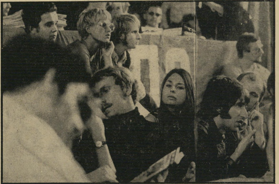
אסיפת סטודנטים שמאלניים בברלין

מי אמר דברים אלה? למרבה הפלא: גרמני. אבל הפלא גדול עוד הרבה יותר. כי הגרמני המסויים הנה, שאמר דבריי-כפירה נוראים אלה, נבחר בשבוע שעבר לנשיא הרפובליקה הפדראלית הגרמנית. והשבוע, עוד לפני שנכנס לתפקידו החדש, הוא עורר סערה לאומית, כאשר אמר כי הצבא הגרמני חשוב בעיניו