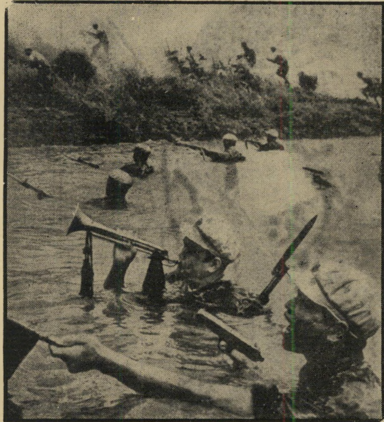
חיילים סיניים עוברים נהר בהתקפה הניאו-נאצים הם בעלי-ברית

הגרמנים לא האמינו למראה עיניהם. אך התרגלו לפלא אחד — בחירתו של גוסטאב היימן לנשיא מדינתם (ראה מיסגרת),