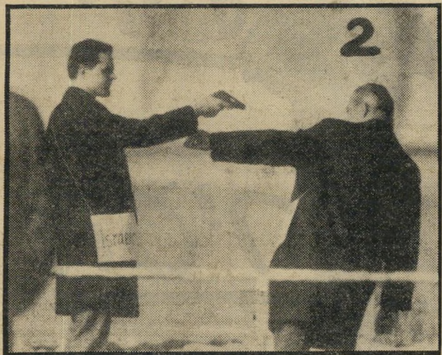
איש המשטרה השווייצר, המייצג את רחמים, נושא שלט "ישראלי". חסן מנסה לסגת מאיום אקדחו, כשהוא נשנן על הגדר. עדותו של רחמים סותרת שיחזור זה, שנעשה על-פי עדותו של סמל משטרה שווייצר.