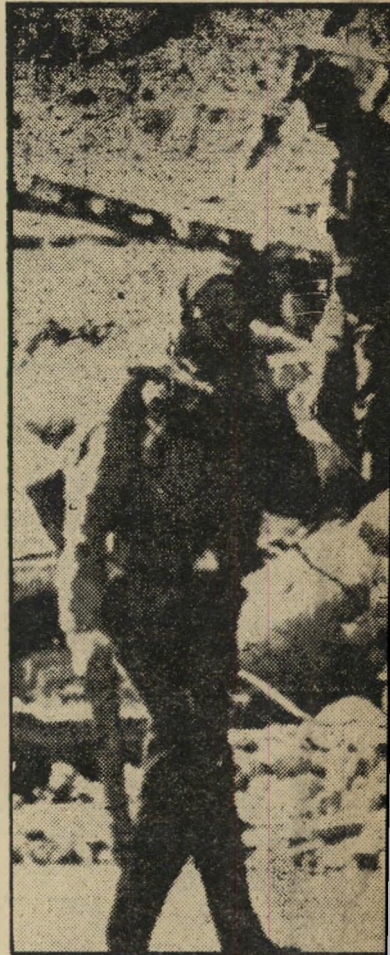
מייסלון — אחרי ההפצצה אין אוהדים לדמשק

פנייה חלושה. גם הפעם היתה זו פעולה אווירית, אולם שלא כמו במיקרה ההתקפה על נמל-התעופה ביירות, נכחרו