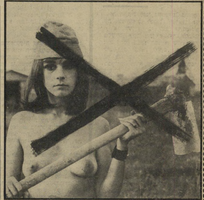
לא צריך חיים לסקוב!