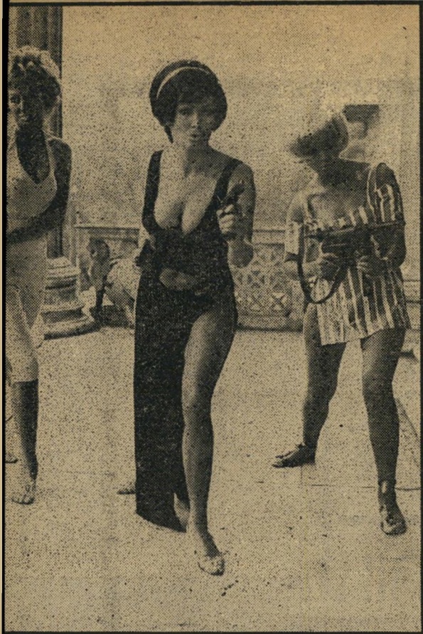
מתפרצות לאולם הישיבות

לחברי הכנסת האוסטרית, שהם יותר ממושמעים מעמיתיהם הישראלים, אין זו שאלה היפוטטית בלבד. זה באמת קרה להם. מכונת ספרוט פתוחה דהרה אל מדרגות בניין הפארלמנט הוינאי, מתוכה זינקו שלוש חתיכות חסופות וידו לעבר חבניין. איש לא נפגע, כי הכדורים היו חסרי קליעים.