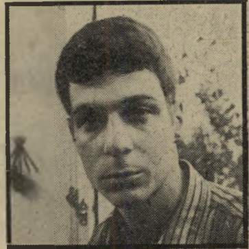
מאחוריו שנת לימודים בפקולה למשפטים באוניברסיטת תל-אביב. דעתו כיום: "צריך לנסות לרכוז את הערבים יחד, בשטח מסוים, ולנסות ליצור להם מדינה פלשתינאית בה תהיה להם אוטונומיה ומערכת-שיפוט. אבל הסמכויות בענייני מדיניות וצבא יישאר בידנו. בערבים הישראלים יש לנהוג כמו שנהגו בהם עד עכשיו. בהכלנים יש לנהוג ביד קשה. במיקרים מסוימים, בהתאם לחומרת פעילותם, יש לפסוק להם ערי-שמות."