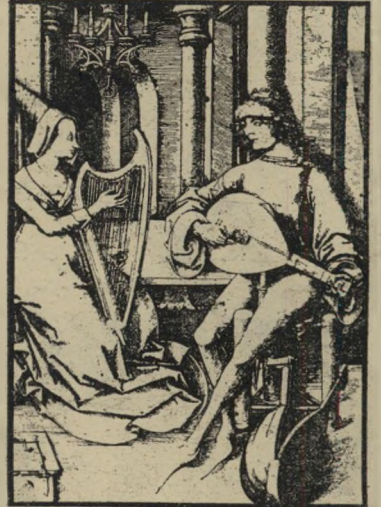
מוסיקת המאה ה-13

*** ארבעה נגנים מעולים, ממינכן שבגרמניה, מהחיים את רביעיית המור סיקה הקדומה , שהגיעה לסידרת קונצרטים. הם מבצעים בצורה מקסימה, יוצאת מן הכלל, מוסיקה של יוצרים שחיו בין המאות ה-13 וה-17. שניים מתוך ארבעת האמנים, הם אף זמרים, ובין עשרת ה-