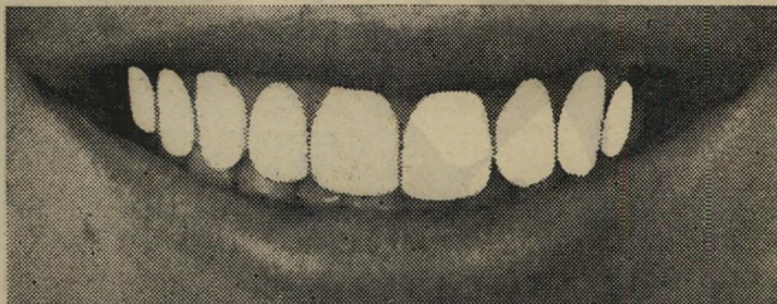
לאחר שמוש סדיר ב-טילאקי

טילאק מוריד את אבן השן. כתמי תה. קפה וטבק מבלי לחרוץ את השן.