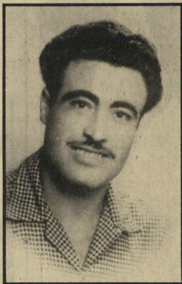
אילם בכור תשע שנים...

אילם גם בחלום. באה מלחמת-ששת הימים ובעקבותיה הוכרזה החנינה הכללית.