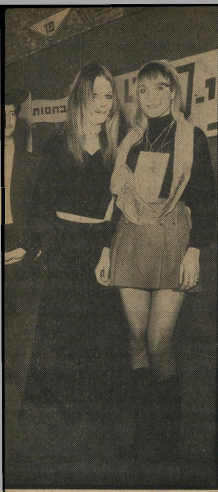
נסיכה רינה זמזכה סימה רץ שתיים העזו

הבריק השבוע שוב. בהופיעו בפני סטורי- טים באוניברסיטה העברית בירושלים, נרם לחילוקי-דעות ולחיכוכים כימעט בכל מש" פט שאמר. למשל: על היחס בין התני"ך להתנחלות — "יש פה אנשים שעושים סלק" ציה של מצות התורה כדי לספק את היצורים הקאניבליסטיים שלהם, הכוונה לחלק מאנשי ארץ-ישראל השלימה". על הכותל המערבי כמקום קדוש — "גם דיר-חזיויוב בקיבוץ של מפ"ם הוא נחלת-השם באותה מידה". על אמונה — "בארץ חלק מן הכופר רים מאמינים בפסיכואנליזה, חלק בטלפ" טיה, חלק בסוציאליזם וחלק במשה דיין."