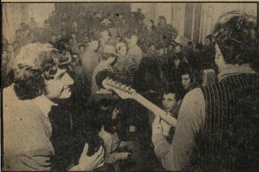
"הכוכבים החדשים" לפני יחידת צה"ל ברצועה