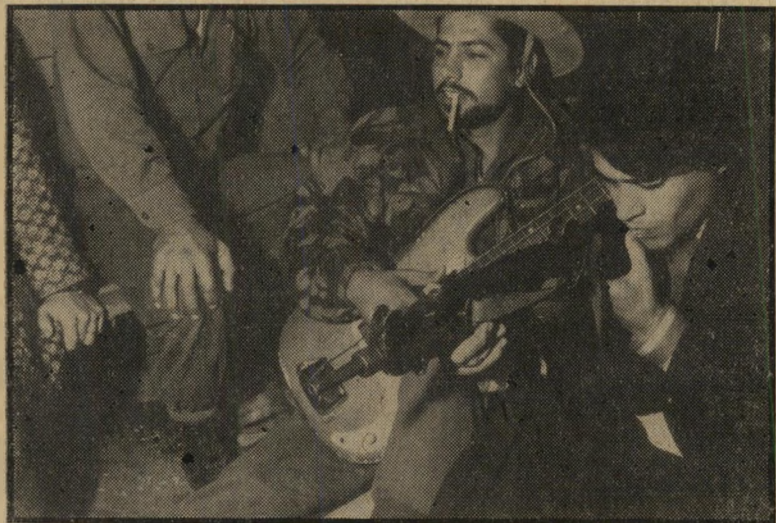
זכיתנו גיטרותיהם ה"עווים"

"קראות-היידו לא הושמעו באולם עירוני ניו או דיסקוטק כלשהו, אלא בחדר-האוכל של יחידת-מילואים בה שירתתי. כשגוייסתי, ביקשו ממני החברה שאדאג להם לי אספקה סדירה של העולם הזה. בין ה"גיליונות שהגיעו ליחידה, הופיעו כמה כתבות על להקות-הקצב הישראליות ועל פסטיבאל-הקצב הנערך בחסות העולם הזה. רוב המילואימניקים לא ידעו איך אוכלים דבר כזה. כשהתקרב מועד סיום השירות,