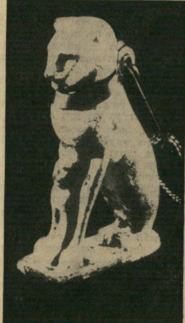
הקמע לביאה בת 3000 שנה, ה- שומרת על גורה. דין מצא אותה בעזה, נתן אותה כשי לבתו יעל.