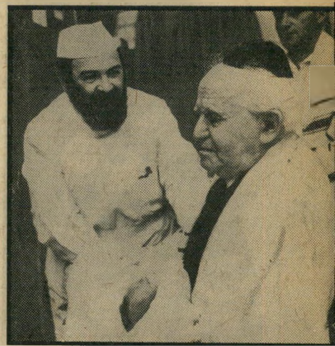
בי ג"י שוצם עיניו -