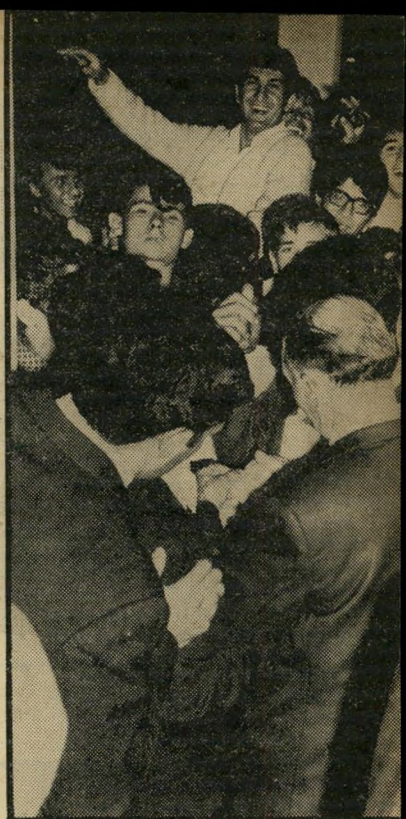
בפתח חסידים נלהבים של מוסיקת הקצב צובאים על פתחי אולם הסינרמה, מחכים בקוצר-רוח נראה לעין לשעת הפתיחה של מופע להקות הקצב.