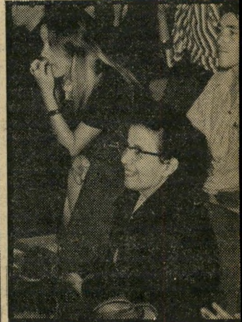
ח"כ צברי ח"כ רחל צב- רי נענתה ל- הזמנת אורי אבנרי, נהנית מהחוויה.