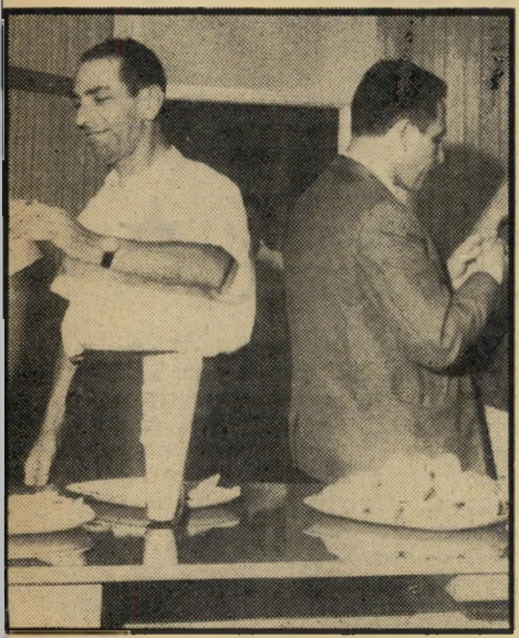
נאווי והרפז ברוגז "כלב מי שגא מתלונן במסורה"

תוצרת ביח"ר נקה בע"מ. המפיצים: חב' נורית בע"מ