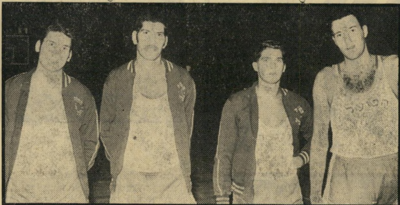
הכדורסלנים האמריקאיים של הפועל ת-א* חובבים או מקצועיים?

משחקים בהפועל ארבעה אמריקאים בתנו אים של כדורסלנים מיקצועיים. הם קיבלו דירות, הם מקבלים תשלום מיומן לימודים. הם, ובקרבם כפי שהובטח להם, יקבלו מכונות. השאלה העיקרית היא, האם קבור צת הפועל ת"א היא חובבנית או מיקצוענית?