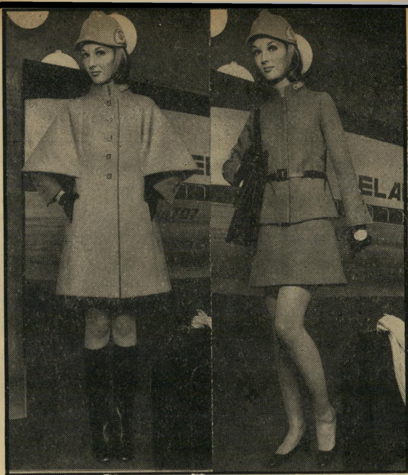
שכמיה ומדים חדשים לדיילת, „אל-על” במקום פרת משה רבנו — כובע מכביאש

„החלטתי על שלושה חלקים ומעיל. אך כשבאתי לתכנן את המעיל עמדה לפני בעייה: אני לא חושב שמעיל יכול להלבש על חליפת חורף עבה כי הוא צריך להיות בעל נפח גדול עם שרוולים רחבים או קטן מאוד — שיק! וזה כמובן מכביד על הכתפיים. לכן החלטתי על חצי שכמיה. זה פשוט נוח לתנועה, והידיים חופשיות, אין שרוולים וזה נראה קל. אין את הכבדות של המעיל ולמרות שזה לא קו אופנתי זה סרטי ומיוחד.”