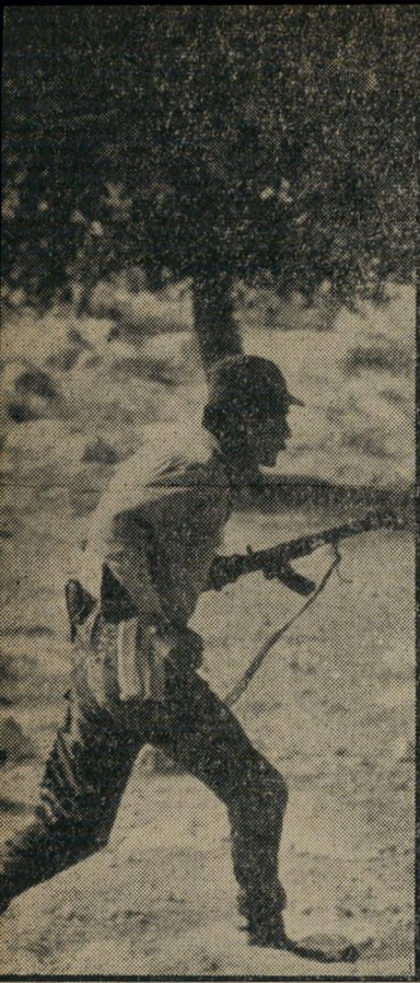
במערב הירדן תמונה זו צולמה ל־ דברי העיתונאים האיטלקיים, לאחר חציית הירדן. נראה בה חבלן הרץ לתפוס מסתור.