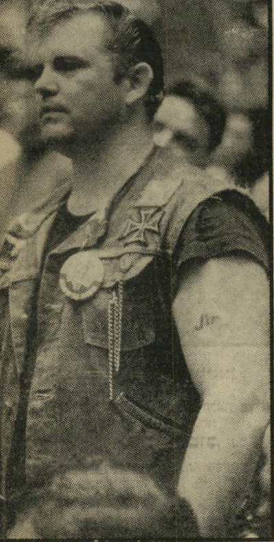
וואלאס, צלב ברזל וצלב הקרס

אולי טמונה התשובה באי-השיויון. מרידות הכושים קרעו את המכחה מעל פני האגדה של ארץ-השפע. נתגלו תהומות של עוני ותיסכול. מיליוני אמריקאים גרים בחילות בנות שתיים-שלוש קומות, בפרברים מטופחים להפליא, שבהשאה להם נראית סביון כשכונת-עוני. ולעומת זאת, עשרות מיליונים גרים בסלאמס אשר בהשוואה להם נראית שכונת-התקווה כרובע-עשירים.