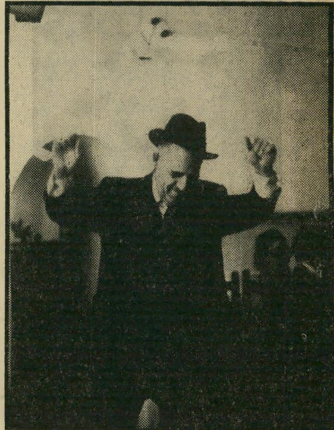
פורמלדו ביום שמחתו עליו במיוחד