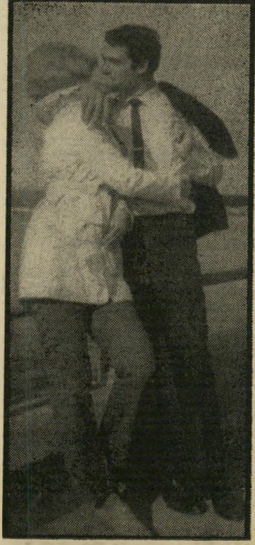
תייר מזרחי במעלה משנה לא-נורמאלי

הפתעתני הראשונה הייתה כשפגשתי את סוואן, נערה אמריקאית טובה, מבית טוב, הוריה גם קיבלו אותי נהדר: