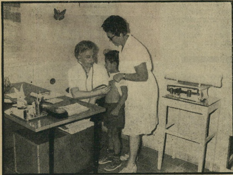
„קופת חולים עממית“, סניף חדרה

המעבדות וכר' עומדים לרשותך ללא תשלום. הבחירה בין המכונים השונים היא בידיך.