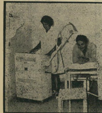
טיפול חשמל במרפאת נתניה

השרות תעיד העובדה שארגון רופאי המדי-נה בחר ב„קופת חולים עממית“ למתן שירות לחבריו. עתה נערך מבצע הרשמה מיוחד ב-60 סניפי „קופת חולים עממית“ ובכל סניפי „דחה“ בארץ. היכנס נא לאחד הסניפים ו-מובטח לך שתקבל ברוח טובה ובאיכות.