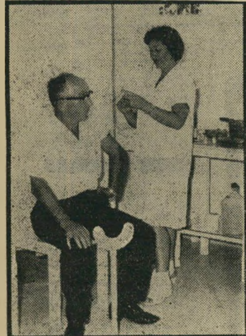
חדר האחות במרפאת נתניה

„קופת חולים עממית“ איננה פנים חדשות בארץ. היא נוסדה בשנת 1931 (כלומר לפני 37 שנים) על-ידי ההסתדרות הרפואית „הר-סה“, ועושה כל הזמן עבודה מבורכת בי-ישובים קטנים ובערים הגדולות. רבים לא שמעו עליה, כיון שלא טרחה לפרסם את פעולותיה, אלא לפעול בשקט פעולה נרחבת. וכיום יש לה כבר 60 סניפים. בינינו לבין עצמנו, מדוע שאתה ואני ורבים אחרים לא