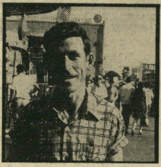
חרה, חניך בעד