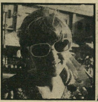
טסלר, מורה בעד