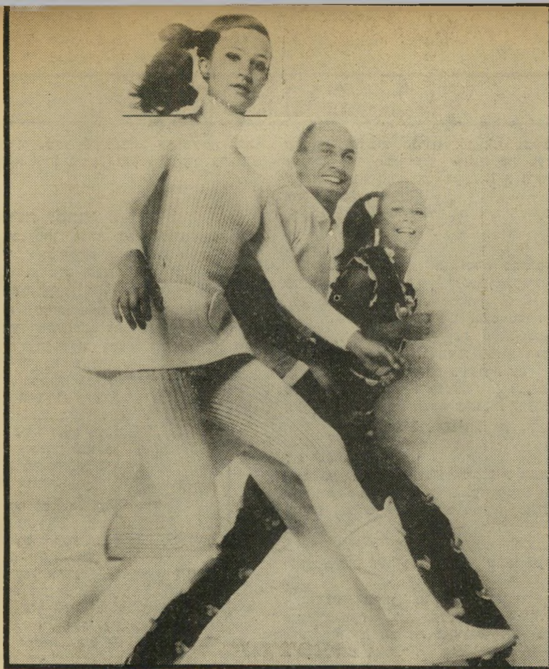
אופנת המיקרו-חצאית של קורו' המת קם לתחייה

אלא שנשיא קונגו, הגנרל ז'וזף מבוטו ששב והרכה צבאית בישראל - אינו