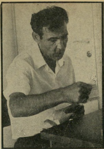
שורף קלמן מה לעשות?

רמי אבנים ברחובות. השבוע היע מערכת העולם הזה קלמן לאלוש. זה