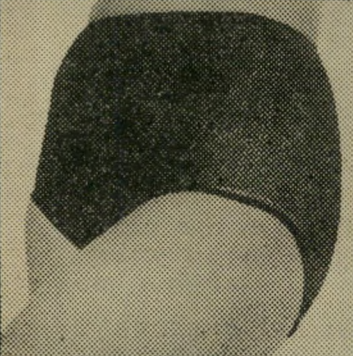
"מנדי" בטוה מכותה