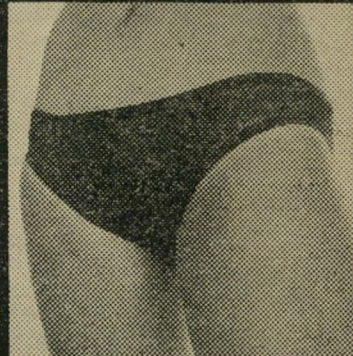
"מיני-קיני" לצעידות ברוח

"גליה" של רוטקס עשוי מחוטי הלנקה גומי טוב יותר. מתיחה לשני כיוונים טובה יותר. מידה אחת לכולן. בדוגמא רוילה ובקיני בשלל צבעים.