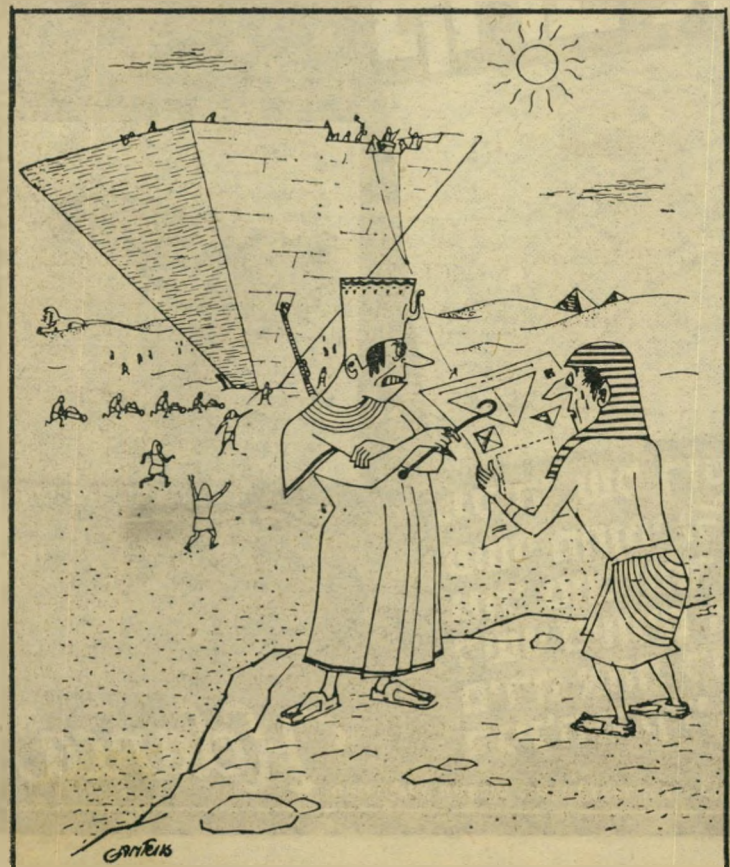
"אידיונו! אתה לא רואה שהתוכנית הפוכה?"

לכבוד לשכת הגיוס אני עומד להיות אב בעוד ארבעה חודשים ומישהו סיפר לי כי זה יעזור לי לקבל פסור מגיוס. אם לא קשה לכם אנא הודיעו לי אם הדבר נכון, כי אם התינוק לא יציל אותי מגיוס — אני לא מתכוון לשאת את הנערה לאשה. לכבוד רב דויד דקל, הנביאים 31, תל אביב