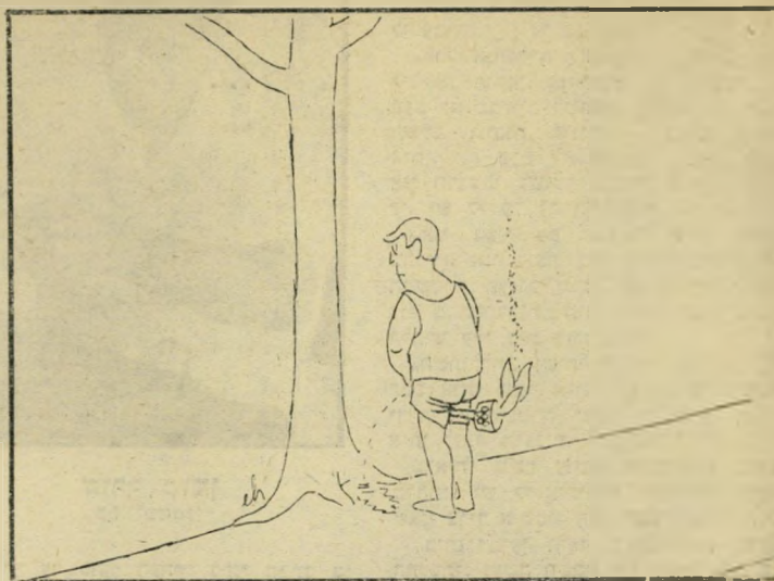
הלפיד האולימפי בדרך

אגדות במדים ערב חג הסוכות דאגה הרבנות הראשית לשלוח לכל יחידות צה"ל ומשמר הגבול אתרוגים ולולבים, כדי שיוכלו לקדש את החג כראוי. כן הגיעו לולב ואתרוג גם ליחידה המורכבת כולה משוטרים דרוזים וצ'רקסים. לפני כניסת החג הופיע המפקד היהודי ביחידה הדרוזית צ'רקסית. עמדו אנשי הכומות הירוקות במסדר חגיגי כשלאפניהם, בתוך ריבוע קרקע עגור, נעוץ הלולב. "זה השתיל ששלחתם לנו", הסביר הסמל הדרוזי, "שתלנו אותו באדמה. אבל עם הלימון ששלחתם — לא ידענו מה לעשות."