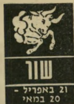
שור 21 באפריל - 20 במאי

בה תצטרך להתאפק יר' תר מכל היא דווקא ב' ימים רביעי, חמישי ו' שישי. אחר-כך מוטב ש' התנפש במיקצת, תצא לטיול או תיקח חופשה כלשהי — רצוי בחברה חדשה. ליל-שבת ושבת הם ימם טובים לרומאני-טיקה ולפגישות עם אנ' שים חדשים לגמרי. עשי ספורט עם ידידייך, ואל תחמיצי הזדמנות המושטת לך ח'נים.