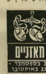
חאזנים 22 בספטמבר - 22 באוקטובר

שייח'המישקל, המשמעות הכפולה והאיזון לו את שואפת, מופרים, השבוע, באופן חי- מור על-ידי שני גורמים החודרים לחייד ב' צורה ברומאלית. אם יש הזדמנויות בחיים בהן אשה צריכה לתת לעצ-מה דין-וחשבון על מעי-שיה — השבוע הוא ה' זמן הנכון. אבל ספק אם תוכלי להתגבר על גלי הפחד וההתלהבות האוחזים בך. ככלות ה' אחת נוטה כלפי מטה — השנייה מתרוממת בחזקה. לבשי ירוק או אפור, או ירוד. אם אתה איש-עסקים — אתה עלול להפסיד הרבה, לא במובן הכספי, בעקבות החלטה שרירותית שנקסת בחיפזון.