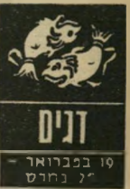
דנים 19 בפברואר - 17 במרץ

זוהי תקופה משעממת, אפילו מייגעת. דווקא משום כך אסור לך לנותר או להפקיר את האינטרסים שלך. שמור בשבע עיניים על רכושך, כספך — וידידותיך. יש כאלה המעוניינים בכך לט, ואלה הימים בהם הם גם מסוגלים לקחת את כל הדברים היקרים האלה מידך. אל תסמוך גם על ידידים, ואפילו לא על קרובי משפחה. עשה הכל במרידיך. כן מראה מזלך השבוע, ב'דגים, כי אין זו ה' תקופה הנכונה לבקש טובות או עזרה.