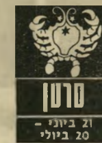
סרן 21 ביוני - 20 ביולי

מה שמרגיז אותך הוא שכל אשר יקרה לך ה' שבוע כבר אירע — פחות או יותר — בהד' דמנויות קודמות. זוהי אכזבה בשביל אישיות רומאנטית שכמותך, ב' יחוד לאור העובדה ש' חוש-העסקים הבריאי ה' מסתתר מתחת לחוסר-