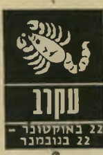
עקרב 22 באוקטובר - 22 בנובמבר

שוב הדיכאון הזה! אבל יש לך סיבות טו-בות ורבות לכך. הכישלונות והנסיגות ה' ללו, אם כי הם לא חשובים ביותר, לכאורה, בהם כדי להעכיר את רוחך. התקופה