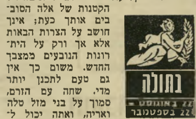
בתולה 22 באוגוסט - 22 בספטמבר

אבל הכנסה כספית נאה ובלתי-צפויה מאזנת במיקצת את המצב. אל תסתנוור.