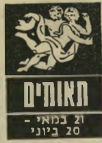
תאומים 21 במאי - 20 ביוני

אל תאמיני לו! הוא סתם מבלבל את המוח. ההבטחות המושמעות באוזנייך, בת-תאומים, בתקופה שעד יום שישי, לא שוות את האוויר ש- אליהן הן יוצאות. בכלל, מעין תרדמה אופפת אותך בימים אלה. דומה, שככל ש' את משתדלת לצאת מן הבצה הסמיכה ה- זאת, כן את שוקעת יותר באפס-מעשה ו' בשיממון. רק עצתו הנבונה של אדם מבוגר עשויה לעזור. והזמן, כמובן, עו- שח את שלו. בכל אופן, אין להתיאש.