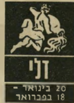
דני 20 בינואר - 18 בפברואר

דרך אגב, את נקלעת לאחת הסיטואציות הכפולות והלא-פשוטות, להן את מומחית. הם יכעסו עלייך, אולי, אך כוח אישיותך וקסי מייך האישיים יטייעו ב' ערך לצאת גם מהסבך הזה. אם אתה לא רוצה להסתבך בעסקים, מוטב שתתייעץ הפעם עם רואה-החשבון שלך או עורך-הדין שלך. ר' תשים קצת יותר לב ל' מחלות-יפנים: כליות, כ' בד וכדומה. בתדלי — היהורי מנטיעות תכופות יתר על המידה, ביחוד בסופי-שבוע.