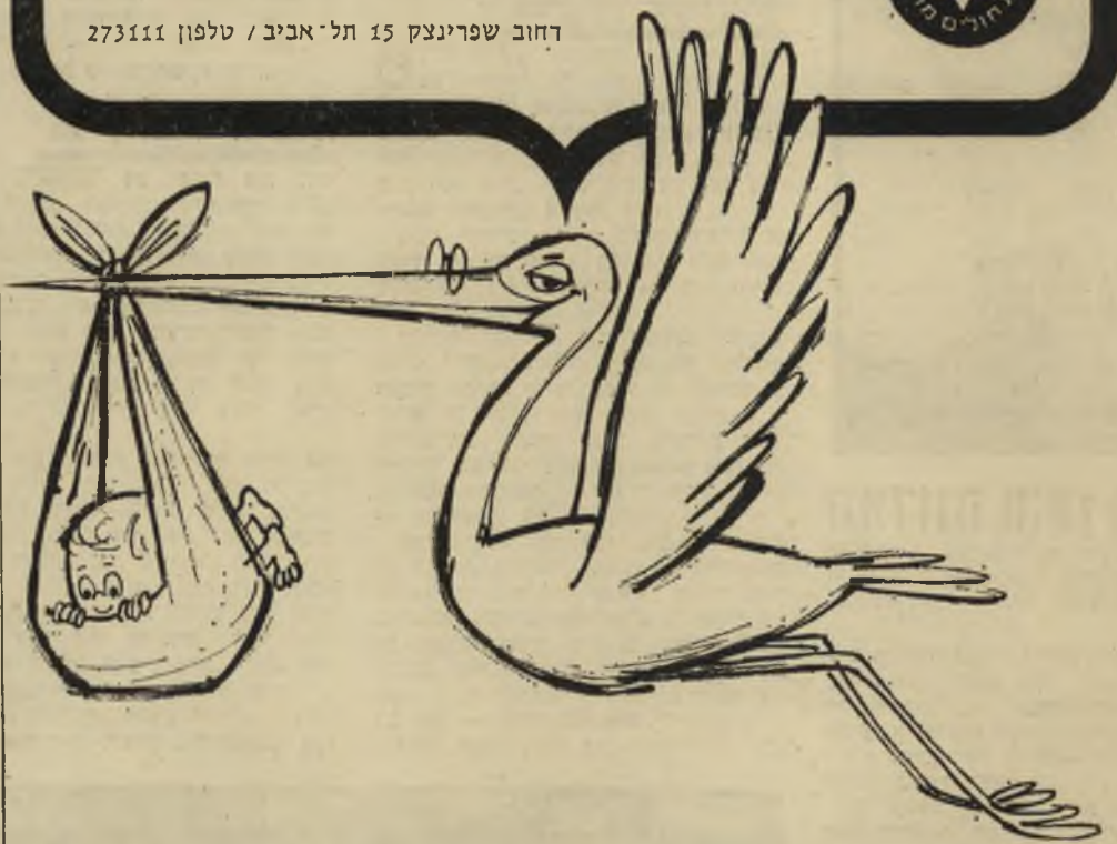
פרטים: א. גלבזום