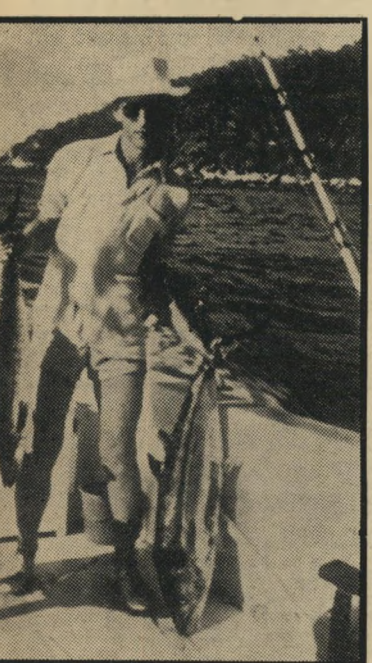
הנסיך צ'ארלס מחזיק שני דגים גדולים, ומציד העלה בהכתו על טיפון יאכטה מלכותית.

"דיילי אקספרס" הלונדוני הדפיס תמונה של המלכה אליזבת במיטה — והוצף במבול של כעס והשמצות. הוא נאלץ לפרסם מודעה על עמוד שלם ב"טיימס", בה אמר שיתר העיתונים התנפלו עליו רק מתוך קינאה. יחד עם יתר התמונות בעמוד זה, שפורסמו לראשונה ב"מאטש" הפאריסאי, מהווה הסידרה פנסאציה בלתי רגילה. בייחוד שאין איש מוכן לגלות מי מבין באי בית המלוכה מכר אותן לשבועון.