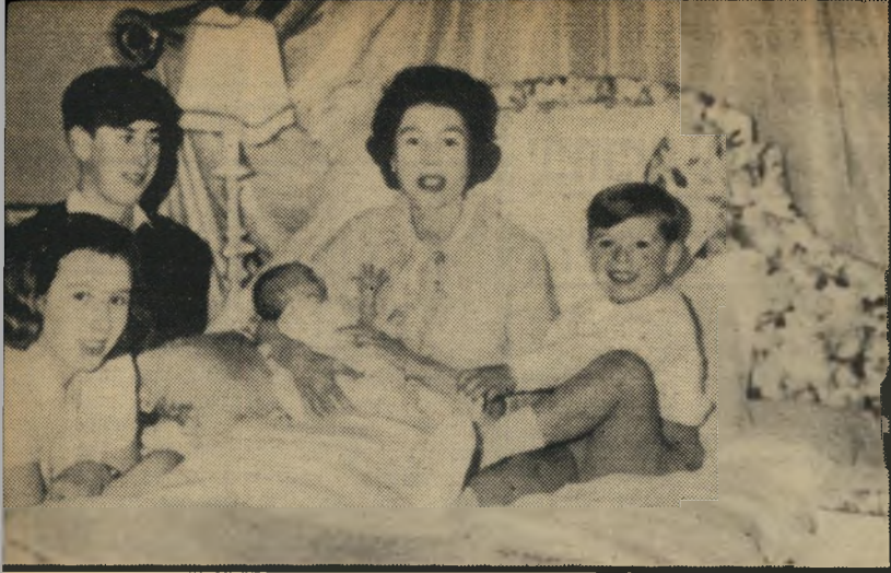
התמונה צולמה זמן קצר אחרי לידת הבן המלכותי הרביעי, הנסיך אדוארד, הנראה בידי המלכה אליזבת. לידה על המיטה הנסיך אנדרו, ומשמאל: יורש העצר הנסיך צ'ארלס ואחותו הנסיכה אן.