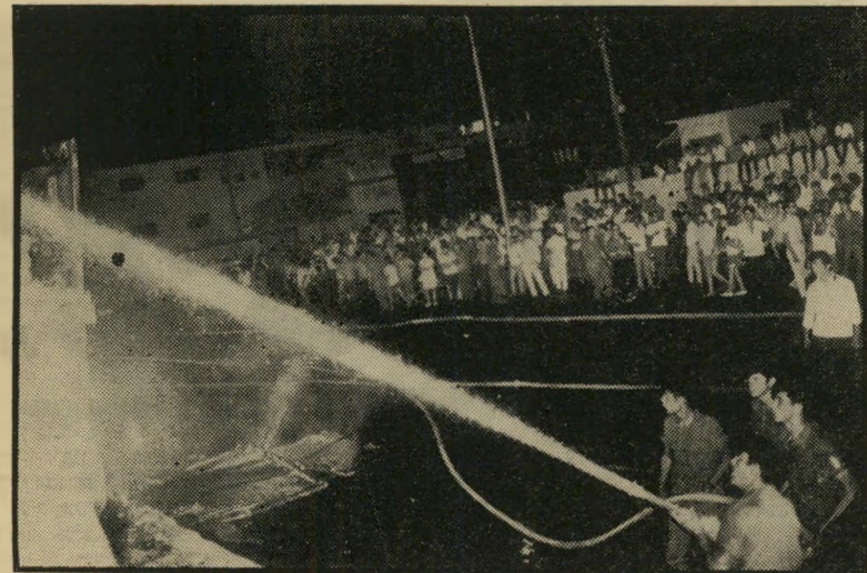
השריפה ברובע הנגריות הצתה או דליקה עצמית

„הדבר היחידי שתוכנן בשביל שטח זה — הם מיבני-מלאכה טובים יותר... ומה עם האפשרות להצתה, כדי לגבות דמי ביטוח? מסתבר שעיסקי-הנגריות, במקום, אינם כושלים. להיפך.