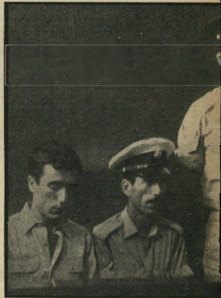
מניח-הפצצה ב"מרכז" מסארווה פרייביאושים

תהליך מתגבר? השבוע נידמה היה, כי כל התהליכים המדויגים האלה הבשילו את פריהביאושם שלהם. המשטרה עצרה ארבעה עצירים מבני הכפר טירה שב- משולש, שהואשמו בכך, כי בחסות מועדון הספורט המקומי התארגנו כתא מחתרתי, אשר קיבל הדרכה, נשק ויעדי-פעולה מ- איש אל-פתח בשכם. אחד מבין הארבעה