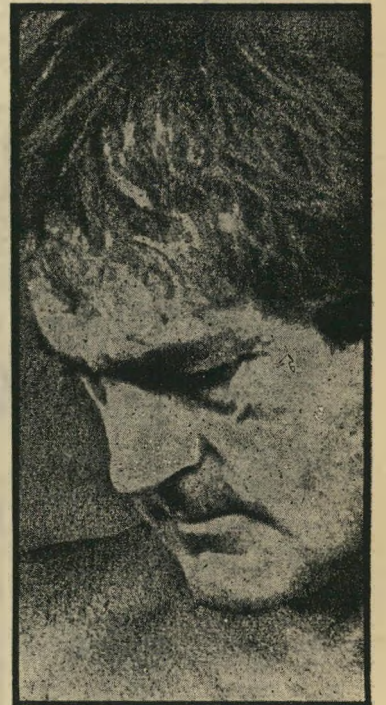
נביא לירי אליל מיושן

לירי נעצר, שוב ושוב — והתחיל לשעמם את הקהל הצעיר האמריקאי, צמא-החדשות-