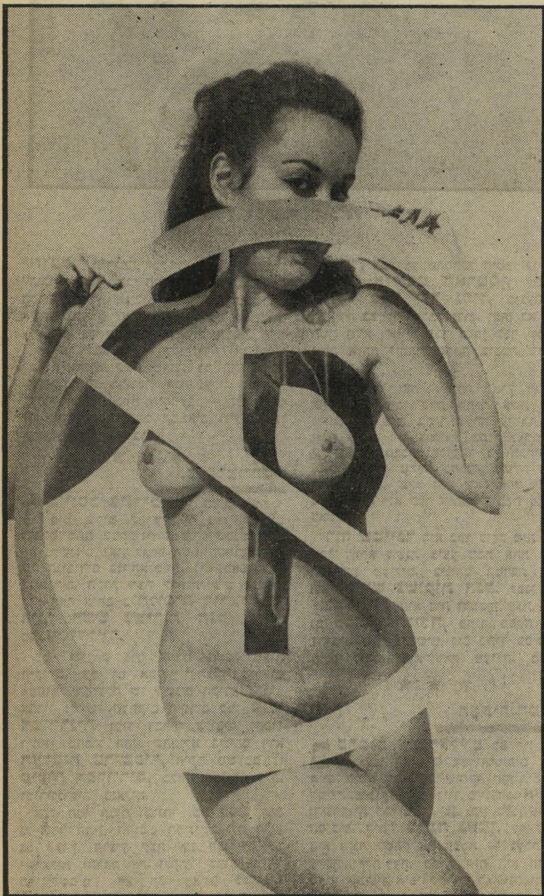
אין חנייה - ובוודאי לא בצד ימין