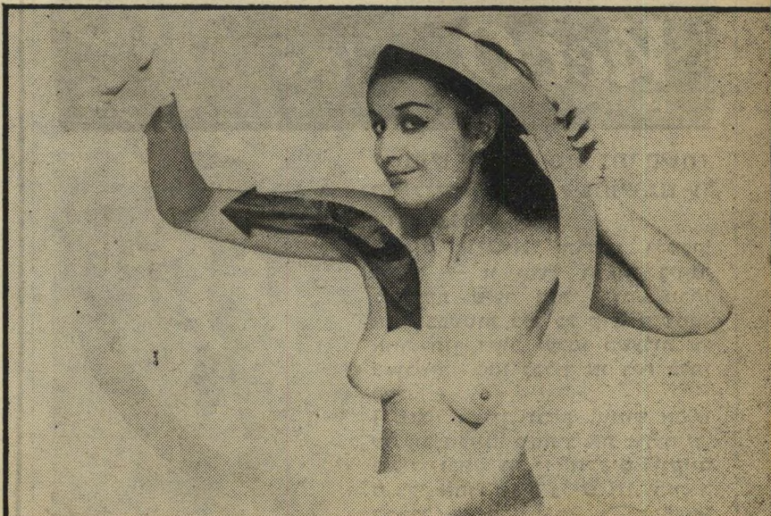
האם - חנייה שמאלה לפניך