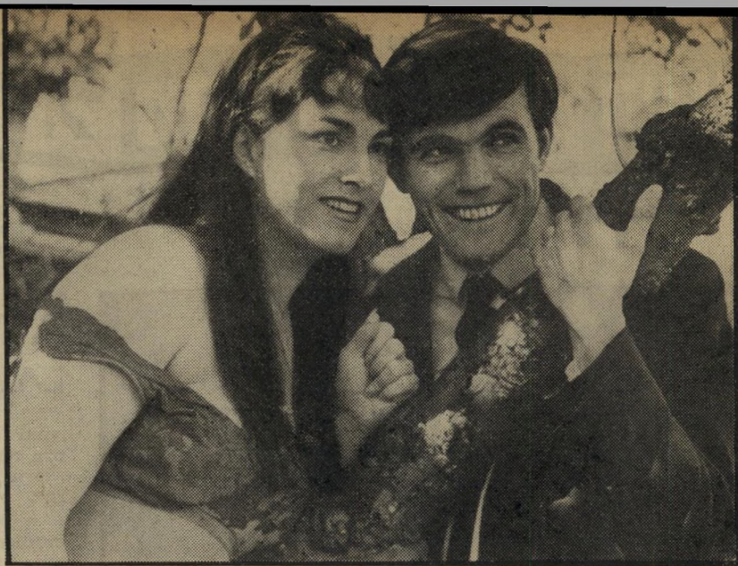
1. יוליסס (אנגליה)