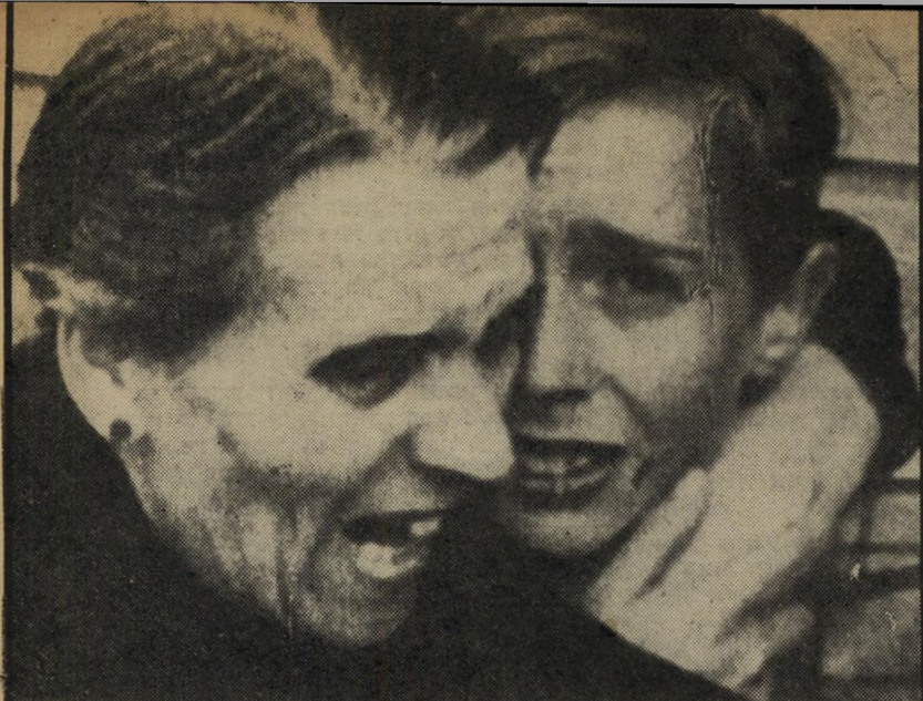
2. למות במאדריד (צרפת)