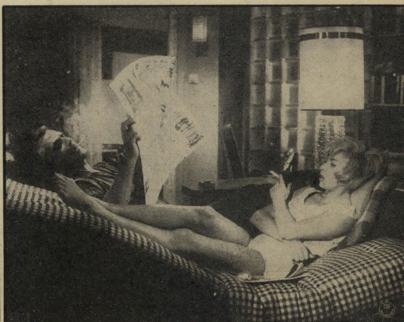
1. המצלצל המסתורי (גרמניה)