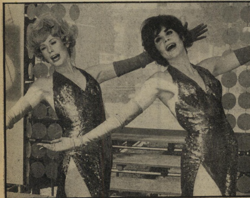
2. העלמות מרושפור (צרפת)