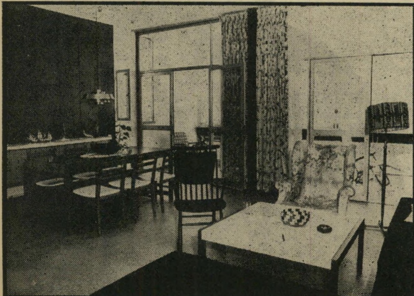
חדר-האורחים משולב במדר-האוכל, ממשיך בצורה טיבעית אל מירפסת נהי דרת, רחבת, המשקיפה ישר אל עבר חוף היס. הריחוט פשוט, עכני, נקי-קווים — ונח עד מאוד. אופיו מתאים לצווי הארכיטקטורה הפנימית המזדרנית.