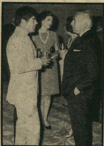
עם הקונסול — ומודרני

„בחור שזוף שנחון ביכולת להרוג. הוא משרת על ספינת טורפדו כקצין, כשתפקידו לשמור על שיירות הסוחר של הצי הבריטי.“ לדעת יוצרי הסרט מתאים בריותי לתפקיד משום שכמו רוב הישראלים יש לו תפקיד