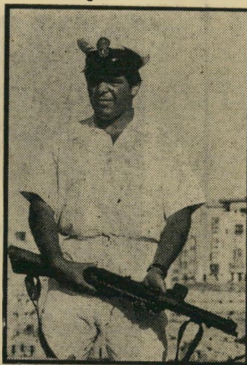
עם סטן — ישראלי