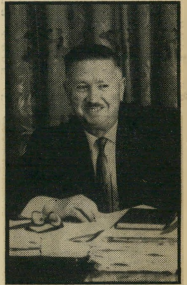
ראש-עיר כנען — שלב-מקשר