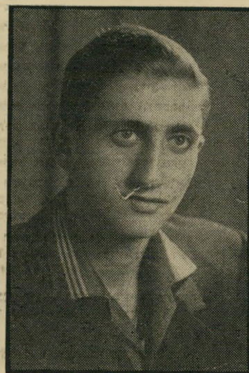
עצור צברי טוקאן — נגד חשוד בחבלה

שכונת-האמידים רפידה, כארבעה קילומטר מערבה משיכם.