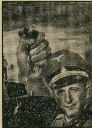
איש השנה תש"ך רכז השואה אייכמן

ייתכן שזאת הסיבה העיקרית לכך, שאיש-השנה של "העולם הזה" הפך למוסד שאין לו מתחרה. זוהי בחירה שרק אנו עושים - כי רק אנו מסוגלים לעשותה בלי מורא ובלי משוא פנים.