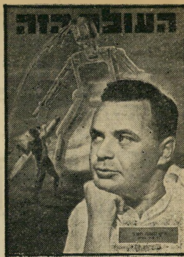
איש השנה תשנ"ז פרקליט תמ"ר

...אתם מטיפים בהסתמך על הגיון מדיני ועל כראיותה של ישראל לנקוט בקו מסויים. (המשך בעמוד 6)