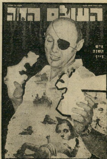
איש השנה תשכ"ח שר-ביטחון דיין