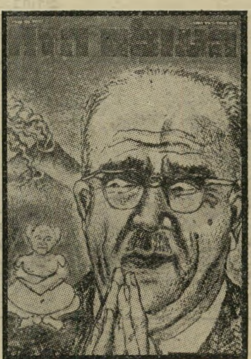
איש השנה תשכ"ד ירוש אשכול