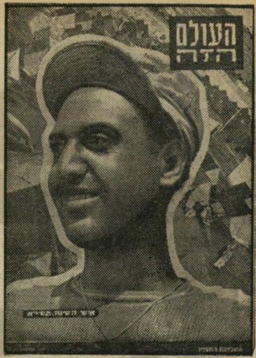
איש השנה תש"א העולה החדש