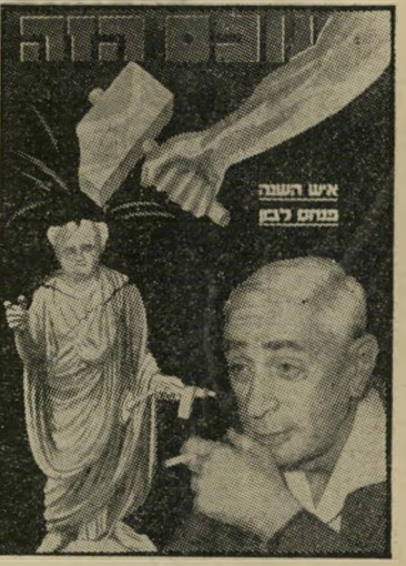
איש השנה תשכ"א מודח לבון