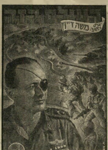
איש השנה תש"ז מצביא סיני דין