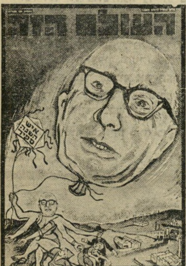
איש השנה תשכ"ז כלכלן ספיר