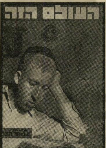
איש השנה תש"ח חתן התניץ חכם