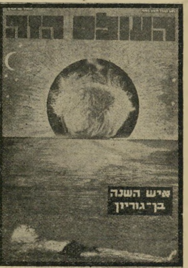
איש השנה תשכ"ג מתפטר בן-גוריון