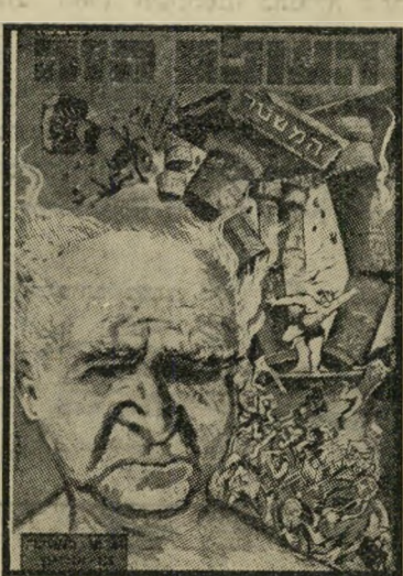
איש השנה תשכ"ה מפלגמפא"י בן-גוריון