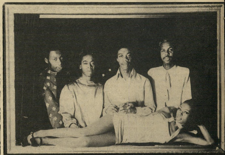
זמרי, הקטיפה השחורה"