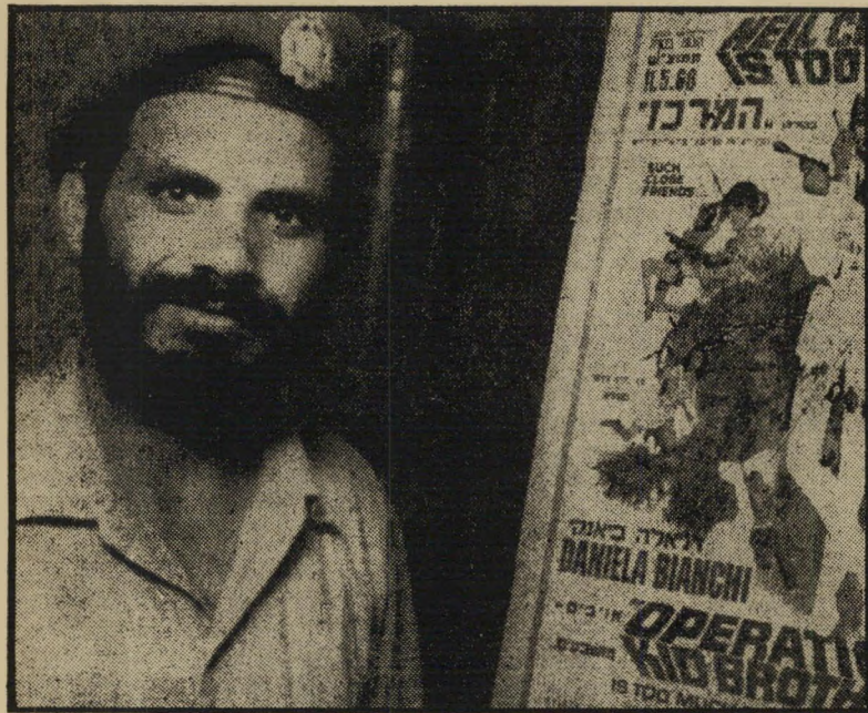
גיבור סעדיה מנצור ליד "מרכז" 7 ילדים + משפט

הגואל הגיע. המנצח הוא עסקן בכיר בועד הפועל, באיגוד המיקצועי וגם תושב ותיק של השכונה מחנה-יהודה, פרבר עצמאי העומד להתמזג עם ראשון-לציון.